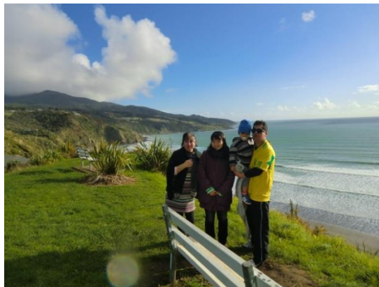
NZのホストファミリーと、車で1時間ほどの海岸で

受講歴：4年5カ月（週2回）／ADVANCED Leo学習中／ JET（ジュニア・イングリッシュ・テスト）1級取得