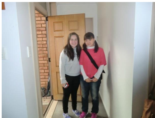
ホストファミリー宅で、親戚のお子様と

That was very exciting! I want to visit New Zealand again.